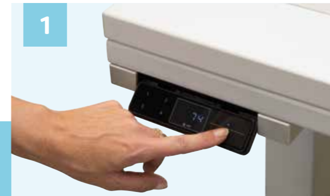
1 Maximale Flexibilität durch optionale elektrische Höhenverstellung mit Memoryfunktion