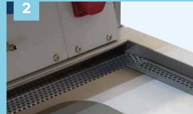
2 Systemintegrierter Absaugkanal