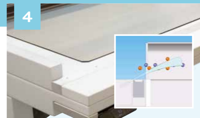
4 Spezielle Luftströmung über der gesamten Arbeitsfläche verteilt positive und negative Ionen