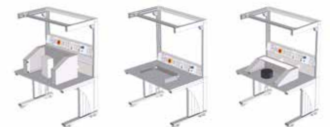
Jeder Tisch kann auf individuelle Anwendungsbereiche abgestimmt werden

Durch die Höhenverstellung kann der IAT 1200 als Sitz- oder Steharbeitsplatz eingesetzt werden. Auch unterschiedlich große Personen können durch diese Funktion optimal arbeiten. Mit diesem flexiblen Arbeitsplatz können fast alle Kundenwünsche realisiert werden. Der Einsatzbereich ist nahezu unbegrenzt.