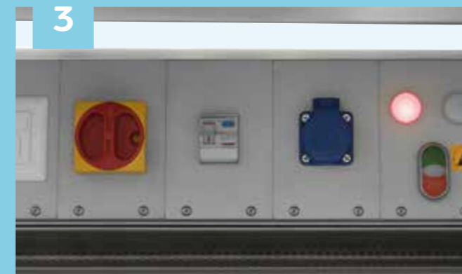
3 Die Medienleiste kann auf individuelle Kundenwünsche angepasst werden