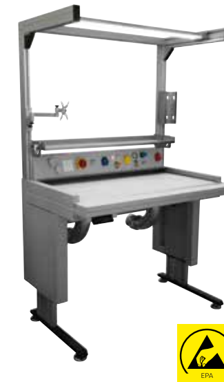
IAT 1200 Automatische 3D-Neutralisierung elektrostatischer Aufladung

Ein wichtiger Bestandteil unserer Gesamtlösungen sind neben den Erfassungselementen unsere Absaugtische, die nahezu jedem Anforderungsprofil angepasst werden können. Ein Beispiel hierfür ist unser Ionenabsaugtisch IAT 1200, welcher vor kurzem in der Fachzeitschrift Maschinenmarkt MM unter der Rubrik ARBEITSSICHERHEIT auf den 1. Platz gewählt wurde.